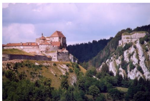
Fort de Joux

Ce café des sages vous propose une après-midi récréative et interactive à la découverte de la Franche-Comté, avec ses paysages, ses principales villes, son histoire, ses personnages célèbres, ses spécificités, son économie et sa gastronomie.